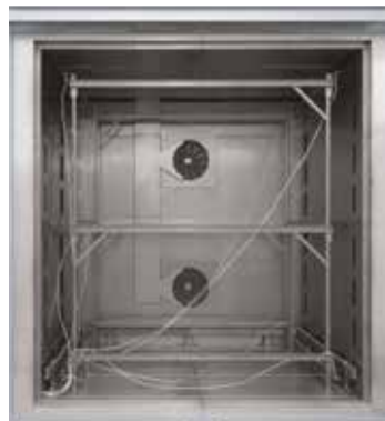
Steckbares Messgestell für Umluft-Kamerofen N 7920/45 HAS