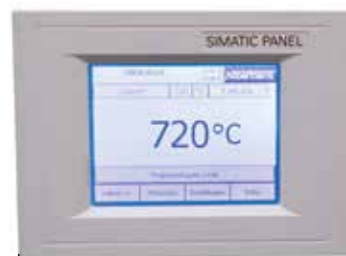
Genauigkeit des Controllers, z.B. +/- 1 K

Beim Standardofen wird eine Temperaturgleichmäßigkeit in +/- K ohne Vermessung des Ofens garantiert. Als Zusatzausstattung kann jedoch eine Temperaturgleichmäßigkeitsmessung bei einer Soll-Temperatur im Nutzraum nach DIN 17052-1 bestellt werden. Je nach Ofenmodell wird ein Gestell in den Ofen eingebracht, welches den Abmessungen des Nutzraumes entspricht. An diesem Gestell werden an definierten Messpositionen (11 mit rechteckigem Querschnitt, 9 mit kreisförmigem Querschnitt) Thermoelemente befestigt. Die Messung der Temperaturverteilung erfolgt bei einer vom Kunden vorgegebenen Soll-Temperatur nach einer vorab definierten Haltezeit. Sofern gefordert, können auch unterschiedliche Soll-Temperaturen oder ein definierter Soll-Arbeitsbereich kalibriert werden.