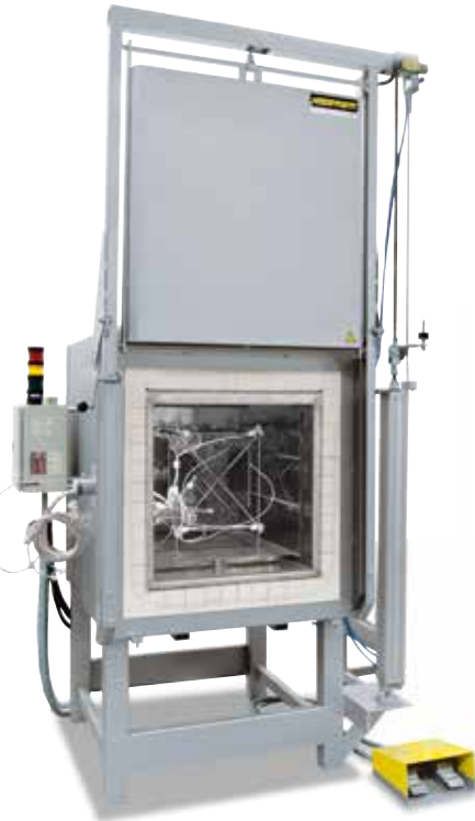
Messgestell zur Ermittlung der Temperaturgleichmäßigkeit

Als Temperaturgleichmäßigkeit wird eine definierte maximale Temperaturabweichung im Nutzraum des Ofens bezeichnet. Grundsätzlich wird zwischen dem Ofenraum und dem Nutzraum unterschieden. Der Ofenraum ist das insgesamt zur Verfügung stehende Volumen im Ofen. Der Nutzraum ist kleiner als der Ofenraum und beschreibt das Volumen, welches für die Chargierung genutzt werden kann.