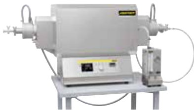
Kompakter Rohröfen zum Sintern oder Spannungsarmglühen nach dem 3D-Druck unter Schutzgas oder Vakuum