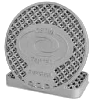
Gedrucktes Bauteil aus Aluminium, wärmebehandelt im Modell N 250/85 HA (Hersteller CETIM CERTEC auf SUPCHAD Plattform)

Das gilt auch für Prozesse, die unter Vakuum durchgeführt werden oder in Öfen, die eine hohe Anforderung an einen geringen Restsauerstoffgehalt haben. Für diese Öfen ist es wichtig, dass diese regelmäßig gereinigt und gewartet werden. Geringste Leckagen oder Verunreinigungen können zu einem unzureichenden Ergebnis führen.