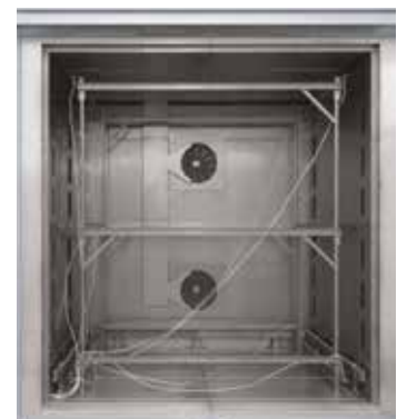
Steckbares Messgestell für Umluft-Kammerofen N 7920/45 HAS