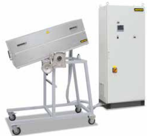
RS 120/1000/11S mit Drehgestell für verschiedene Neigungswinkel

Auf Basis unserer Grundmodelle erarbeiten wir individuelle Varianten, auch für die Integration in übergeordnete Prozessanlagen. Die auf dieser Seite dargestellten Lösungen sind nur ein Teil der Möglichkeiten. Vom Arbeiten unter Vakuum- oder Schutzgasatmosphäre über innovative Regelungs- und Automatisierungstechnik bis hin zu den unterschiedlichsten Temperaturen, Größen, Längen und Eigenschaften der Rohrofenanlagen – wir finden die passende Lösung für eine geeignete Prozessoptimierung.