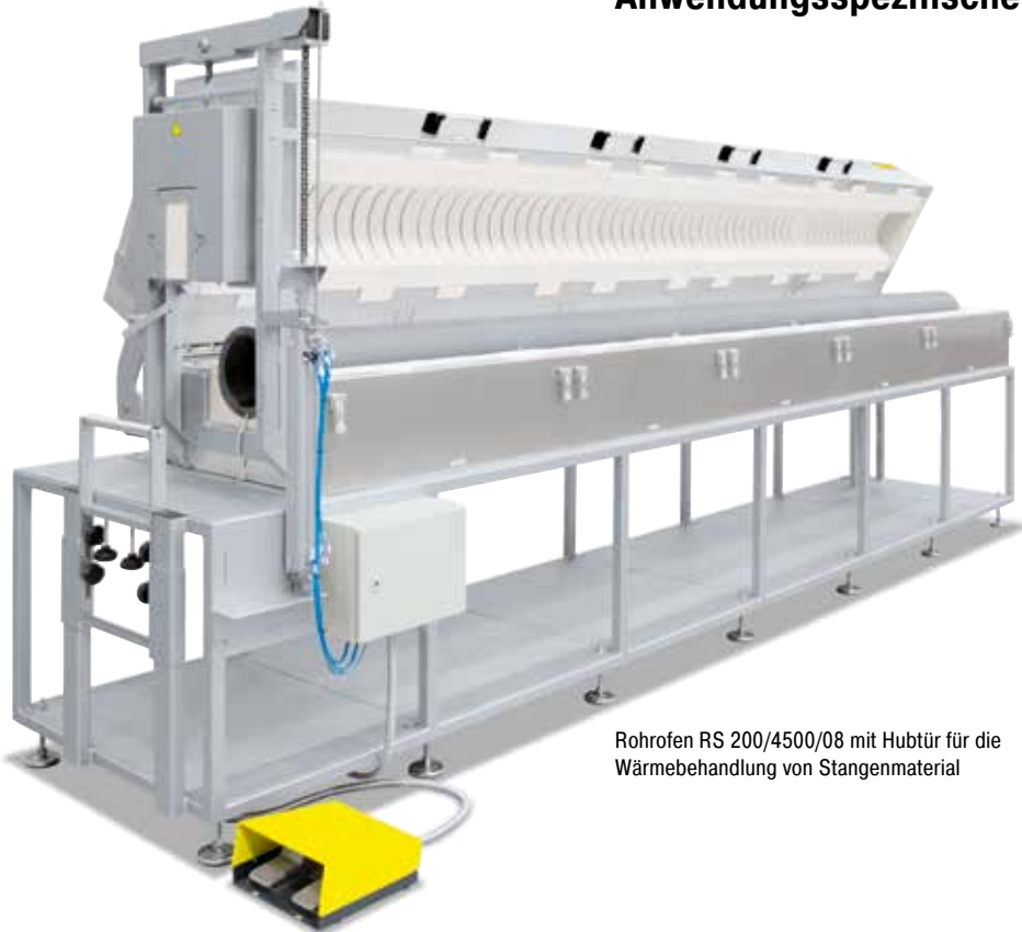
Rohrofen RS 200/4500/08 mit Hubtür für die Wärmebehandlung von Stangenmaterial