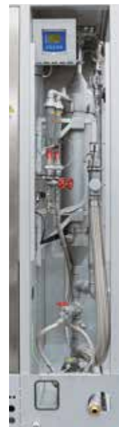
Abgaswäscher für die Reinigung entstehender Prozessgase durch Auswaschen

Ein Abgaswäscher kommt oftmals zum Einsatz, wenn Abgase entstehen, die mit einer Abgasfackel oder thermischen Nachverbrennung nicht erfolgreich nachbehandelt werden können. Die unerwünschten Bestandteile des Abgases werden innerhalb der Kontaktstrecke des Wäschers in einer Waschflüssigkeit abgeschieden. Durch Auswahl der Waschflüssigkeit sowie Auslegung von Flüssigkeitsaufgabe und Kontaktstrecke kann der Wäscher prozessspezifisch angepasst werden und so gasförmige, flüssige oder auch feste Bestandteile erfolgreich aus dem Abgas waschen.