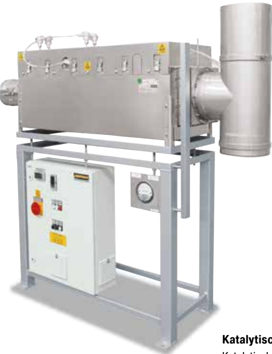
Ofenunabhängige katalytische Nachverbrennung zur Nachrüstung an bestehende Anlagen

Zur Abluftreinigung, insbesondere beim Entbindern, bietet Nabertherm auf den Prozess zugeschnittene Abgasreinigungssysteme an. Die Nachverbrennung wird fest an den Abgasstutzen des Ofens angeschlossen und entsprechend in die Regelung und in die Sicherheitsmatrix des Ofens eingebunden. Für bereits bestehende Ofenanlagen können auch ofenunabhängige Abgasreinigungssysteme angeboten werden, die separat geregelt und betrieben werden können.