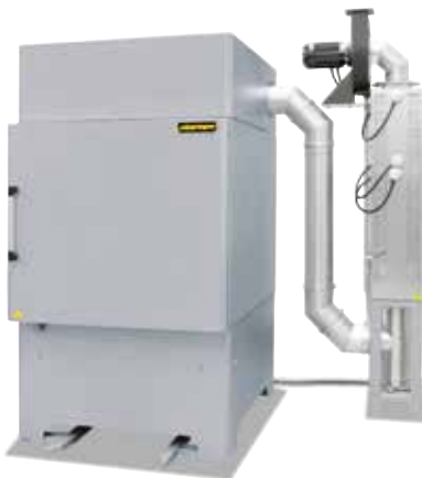
Umluft-Kammerofen NA 500/65 DB200 mit katalytischer Nachverbrennungsanlage