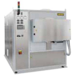
Retortenofen NR 150/11 zum Spannungsarmglühen von Metall-Bauteilen nach dem 3D-Druck