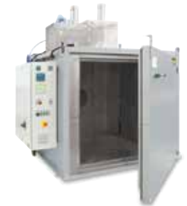
Kammertrockner KTR 2000 zum Aushärten von Bindern nach dem 3D-Druck