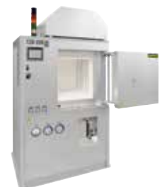
HT 160/17 DB200 für das Entbindern und Sintern von Keramiken nach dem 3D-Druck

Auch begleitende bzw. vorgelagerte Prozesse der additiven Fertigung erfordern den Einsatz eines Ofens, um die gewünschten Produkteigenschaften zu erzielen wie z.B. das Wärmebehandeln oder Trocknen der Pulver.