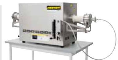
Kompakter Rohröfen zum Sintern oder Spannungsarmglühen nach dem 3D-Druck unter Schutzgas oder Vakuum