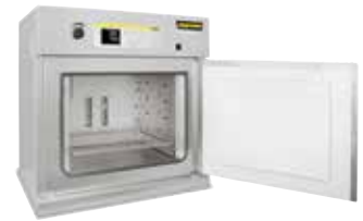
Trockenschrank TR 240 zum Trocknen von Pulvern